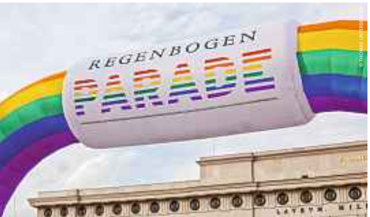
Die Regenbogenparade zieht über die Ringstraße. The Rainbow Parade makes its way along the Ringstrasse boulevard.

Vor dem Rathaus wird bei Life Ball und Vienna Pride gefeiert. City Hall provides the inspiration for the Life Ball and Vienna Pride.