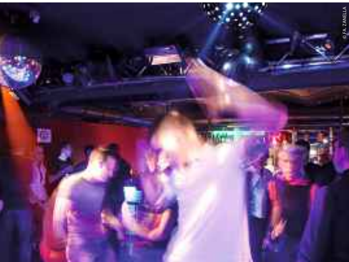
Partystimmung im Why Not. Party atmosphere at Why Not.