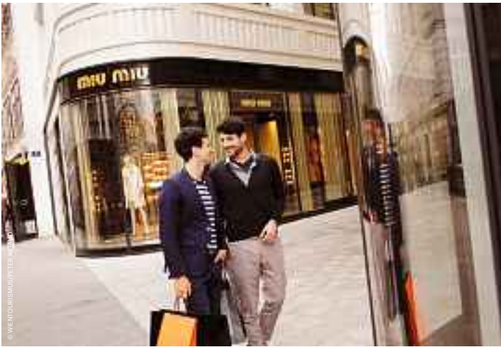
Einkaufsparadies Goldenes Quartier. Shopper's paradise Golden Quarter.

Shopping in Vienna is always a pleasure. A brand new shopping district sprung up in the city in 2013: the Golden Quarter with around 11,500 square meters of luxury stores to enjoy. The luxury shopping district is flanked by Tuchlauben, Bognergasse and Am Hof, and contains numerous flagship stores representing top international designer labels such as Emporio Armani, Louis Vuitton, Prada and 7 for all mankind. Mariahilfer Strasse and Kärntner Strasse are home to dozens of international chains from H&M to Zara.