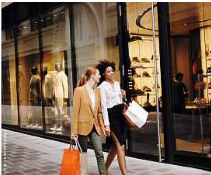
Goldenes Quartier. Golden Quarter.

Walking past St. Stephen's Cathedral (7) and along Graben you reach the Golden Quarter (8) on Tuchlauben, where some of the world's biggest designers have their stores. And once you have shopped to your heart's content cross Kohlmarkt and head for the Hofburg (9) , which is a byword for the luxury of bygone days. Here the Sisi Museum and the Imperial Treasuries await with priceless exhibits and artifacts from the former imperial court. Next, take another short detour and catch your breath at the Volks-garten (10) , where 400 varieties of roses and a monument dedicated to the legendary Empress Elisabeth await.