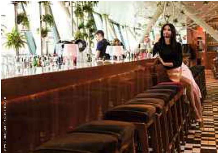
Conchita Wurst im Motto am Fluss. Conchita Wurst at Motto am Fluss.

Delicious cakes – including vegan, gluten and lactose-free creations – are the order of the day at Fett + Zucker in the second district. Frauencafé and Café Standard are both popular lesbian hangouts.