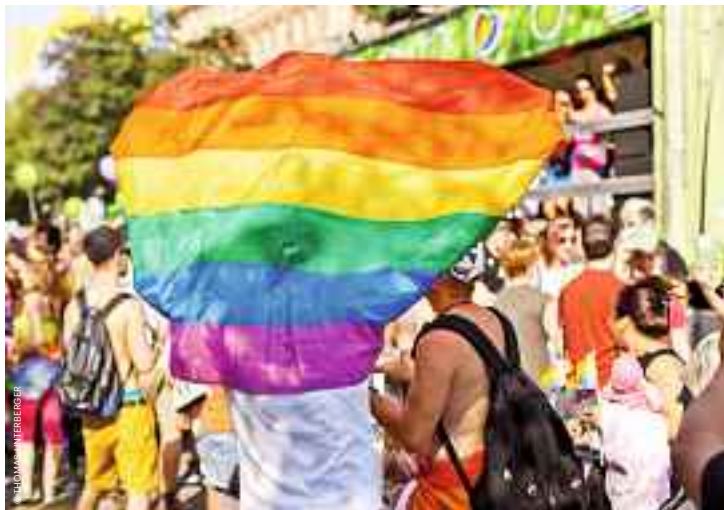
Höhepunkt des Jahres: Regenbogenparade und Vienna Pride The highlight of the year: Rainbow Parade and Vienna Pride.

100,000 people can't be wrong! Every June this many people head for town when the Rainbow Parade (known as the CSD parade in other cities) makes its way along the Ringstrasse. The backdrop provided by the most beautiful boulevard in the world is unique and the message unambiguous: equality for gays and lesbians. The Rainbow Parade marks the climax of Vienna Pride which takes place in the week leading up to it. Vienna Pride brings with it a tent city – usually on Rathausplatz – brimming with information, fine food and an incredible party atmosphere.