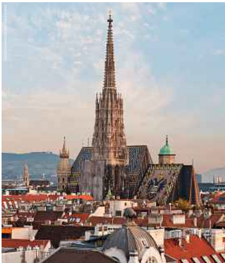
Der Stephansdom ist Mittelpunkt der Stadt. St. Stephen's Cathedral is the city's focal point.

Just a few steps farther on is the Vienna State Opera House (3) , which was created by gay architects Eduard van der Nüll (1812-1868) and August Sicard von Sicardsburg (1813-1868), whose love affair ended in tragedy. The Viennese and Emperor Franz Joseph criticized the building, and van der Nüll took his own life. Ten weeks later Sicardsburg followed him to his death – reputedly dying of a broken heart.