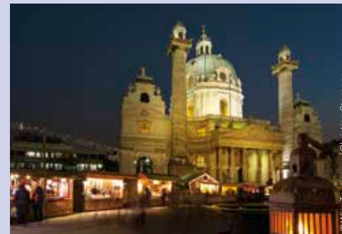
In der Karlskirche erklingt Vivaldi. Vivaldi resounds in the Church of St. Charles.

Ein Tipp bis Weihnachten: die vielfältigen Adventkonzerte in Wiens Kirchen – mehr dazu auf Seite 61. ♦