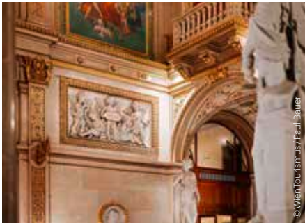
Wiener Staatsoper Vienna State Opera

OPER, OPERETTE, MUSICAL, TANZ OPERA, OPERETTA, MUSICAL, DANCE