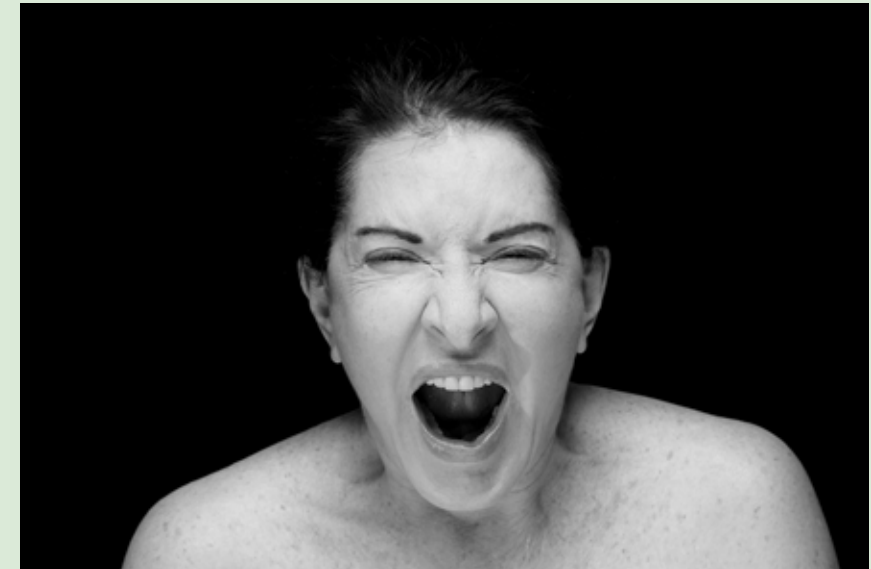
Marina Abramović, Four Crosses, 2019