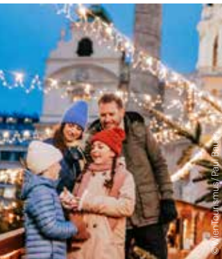
Art Advent Kunst & Handwerk am Karlsplatz Art & Crafts on Karlsplatz