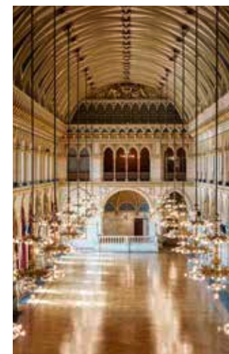
Festsaal des Wiener Rathauses Ballroom of the Vienna City Hall

im Festsaal des Wiener Rathauses / in the Ballroom of the Vienna City Hall Eingang / Entrance: 1., Lichtenfelsgasse 2, Feststiege 1 www.silvestergala.com