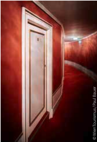
MusikTheater an der Wien