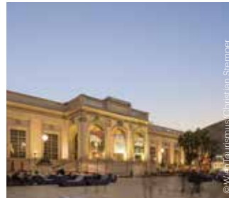
Winter in MQ Winter in the MQ

6., Mariahilfer Straße 103 (Passage) www.kunstsupermarkt.at