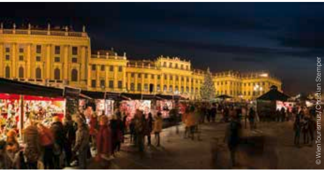
Weihnachtsmarkt Schloss Schönbrunn Christmas Market Schönbrunn Palace