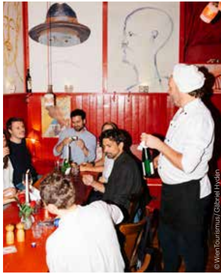
Im Beisl „Zum Roten Bären“ At the Beisl “Zum Roten Bären”

Wien betreibt für eine Metropole eine beachtliche Landwirtschaft innerhalb der Stadtgrenzen. Rund 15 Prozent der Gesamt-