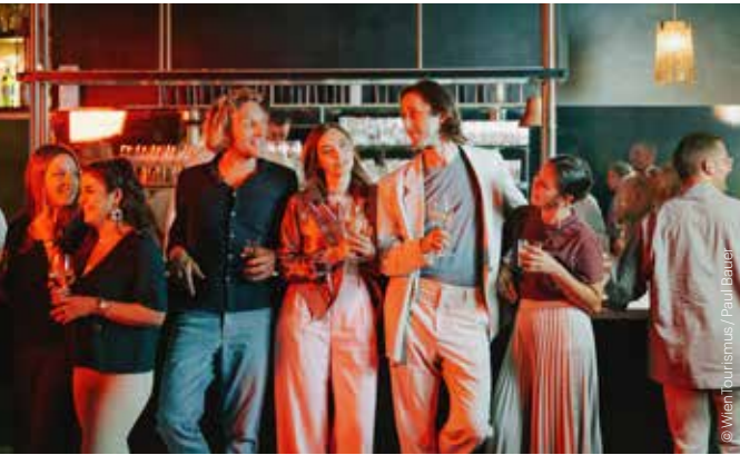
KONZERTE ROCK, POP, JAZZ, WORLD CONCERTS ROCK, POP, JAZZ, WORLD

Arena Auszug aus dem Programm: ◆ CAIROKEE, 1.12. ◆ CARIBOU, 2.12. ◆ ALL SHALL PERISH + PEELING FLESH + VULVODYNIA + NECROTTED, 5.12. ◆ VULVARINE + IGEL VS. SHARK + STEVO & THE SHOTLIGHTS, 7.12. ◆ YASMO & DIE KLANG-KANTINE, 12.12. ◆ AVEC + NO:NO, 16.12. ◆ BLOODSUCKING ZOMBIES FROM OUTER SPACE + EVERYONE'S DARLING + NONSTOP AGGROPOP, 20.12. ◆ ZSK + ROGERS + RUMKICKS, 15.1. ◆ DOTA, 16.1. ◆ EZRA FURMAN, 19.1. ◆ NAKED LUNCH, 22.1. ◆ BEYOND THE BLACK, 23.1. ◆ APPARAT, 28.1. ◆ YOUTH CODE + KING YOSEF + STREET SECT, 2.2. ◆ CLOCKCLOCK, 9.2. ◆ WIZO + ITCHY, 19., 20.2. ◆ KNORKATOR, 27.2. 3., Baumgasse 80 https://arena.wien Haus der Musik ◆ SON OF THE VELVET RAT, 6.12. ◆ DARLING WEST, 15.2. 1., Seilerstätte 30 www.hdm.at Planet Gasometer Auszug aus dem Programm: ◆ ASAF AVIDAN, 5.12. ◆ BLADEE, 7.12. ◆ LANDMVARKS, 12.12. ◆ RIAN, 20.12. ◆ SYMPHONIACS, 8.1. ◆ DANIEL SLOSS, 16.1. ◆ PALEFACE SWISS, 22.1. ◆ AMO & AYMEN, 23.1. ◆ ARCHITECTS, 25.1. ◆ ZAZ, 26.1. ◆ ALTER BRIDGE, 30.1.