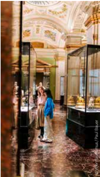
Kunsthistorisches Museum Wien

Künstlerhaus ◆ DU SOLLST DIR EIN BILD MACHEN. Zeitgenössische Kunst und religiöses Erleben (bis / until 8.2.) ◆ FROTH ON THE DAYDREAM Aus der Sammlung Dagmar Meneghello (16.12.2025–8.2.2026) 1., Karlsplatz 5 täglich / daily 10.00–18.00 24.12. 10.00–14.00 www.kuenstlerhaus.at