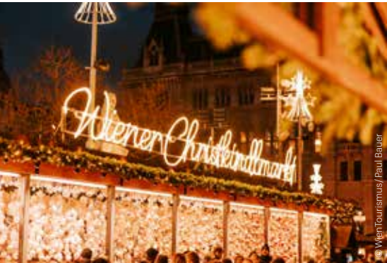
Wiener Christkindlmarkt am Rathausplatz Vienna Christmas Market on Rathausplatz