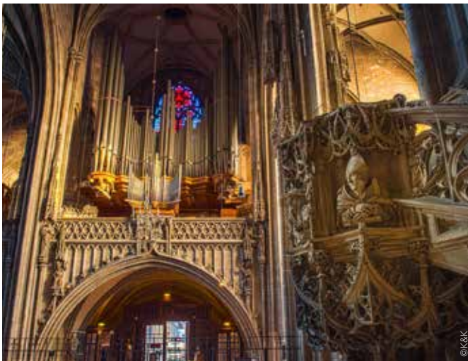
Riesenorgel im Stephansdom The Giant Organ at St. Stephen's Cathedral

Im gotischen Stephansdom, Wiens Wahrzeichen, ist die musikalische Vielfalt zuhause: Bei den Riesenorgel-Konzerten erfüllen mächtige Klänge aus mehr als 12.000 Pfeifen (eine der größten Orgelanlagen Europas!) den Kirchenraum. Top-Organist:innen spielen Programm von Bach über Reger bis hin zu Highlights der Orgelmusik. Der Spieltisch steht zentral im Mittelschiff – beste Sicht auf die virtuellen Darbietungen auf den fünf Manualen.