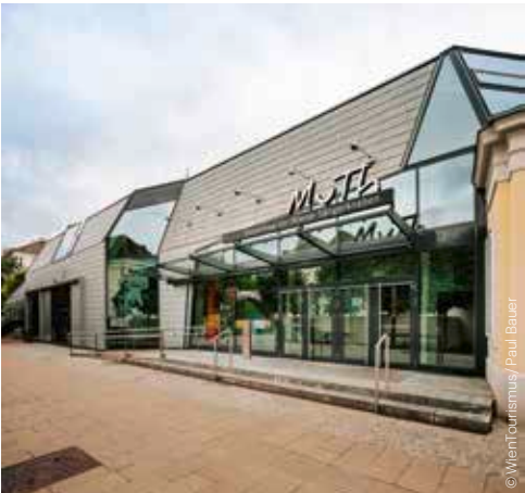
MuTh – Konzertsaal der Wiener Sängerknaben MuTh – concert hall of the Vienna Boys Choir

Wiener Metropol ◆ GO WEST Das Country-Rock-Musical von P. Hofbauer, M. Gull, C. Deix 12.2. (P), 14., 17.–21., 24.–28.2. 17., Hernalser Hauptstraße 55 www.wiener-metropol.at