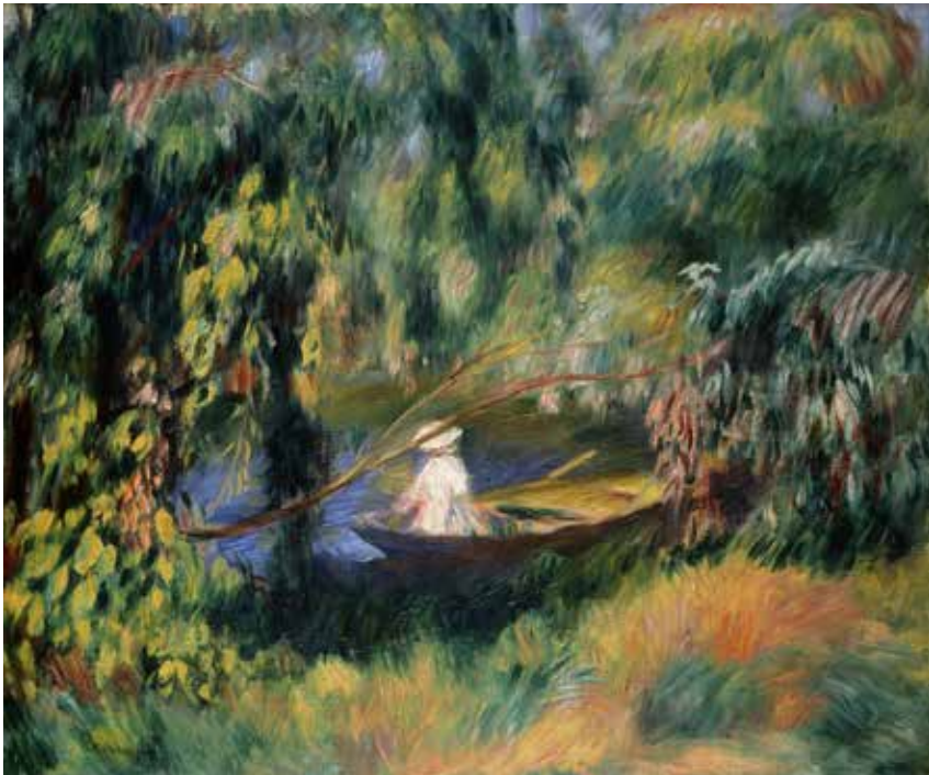
Pierre-Auguste Renoir, Das Boot, um 1878 Pierre-Auguste Renoir, The Boat, around 1878

Die Kulturstadt Wien bietet eine enorme Bandbreite an Ausstellungshäusern. Zurzeit lohnt sich ein Besuch ganz besonders, zeigen die großen Wiener Museen doch ihr saisonales Sonderprogramm. Eine Auswahl an aktuellen Blockbuster-Ausstellungen.