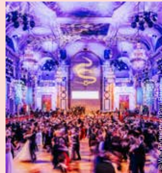
Kaffeesiederball Ball of the Viennese Coffee House Owners

◆ REGENBOGENBALL RAINBOW BALL Parkhotel Schönbrunn www.regenbogenball.at