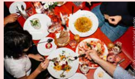
Im Beisl „Zum Roten Bären“ At the Beisl “Zum Roten Bären”

While primarily found in the capital’s down-to-earth Beisl restaurants such as Ubl, Steman, Stern and Zum Roten Bären, Viennese cuisine also extends to its sausage stands and Michelin-starred establishments.