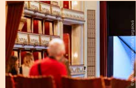
Die Wiener Staatsoper erkunden Exploring the Vienna State Opera

Various music venues in the city can be explored on tours, too – including the Vienna State Opera, which was built in the Neo-Renaissance style in 1869 according to designs by architects August Sicard von Sicardsburg and Eduard van der Nüll. A special tour reveals lots of details that otherwise go unseen by nighttime operagoers. Starting